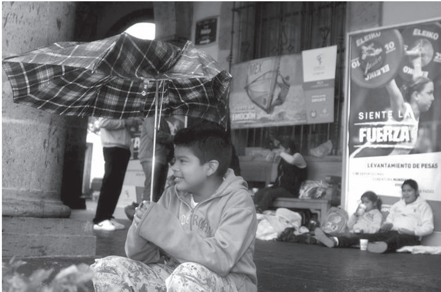
Un niño sostiene un paraguas, frente a varios carteles de los Juegos Panamericanos, ubicados en el Palacio Municipal de Guadalajara en medio de la lluvia causada por el huracán "Jova".

Jorge E. Rocha Académico del ITESO jorge@elpuente.org.mx