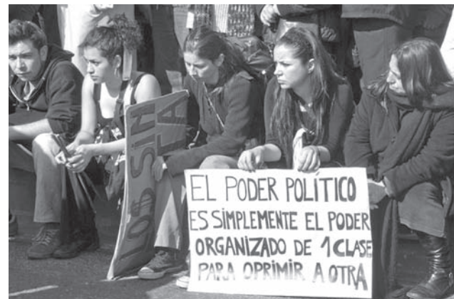
Estudiantes chilenos manifestándose contra el régimen político

La influencia de ésta movilización no sólo se han extendido por Europa, sino que, desde mediados de septiembre, está presente en Nueva York, donde reclaman las mismas demandas que los indignados españoles. Otro ejemplo son las manifestaciones llevadas a cabo en Londres, desde el 6 de agosto de 2011, por cientos de personas tras la muerte de un joven en manos de la policía. Dichos disturbios se extendieron por todo Reino Unido en contra de la policía, debido a la aparente mala relación que ésta institución tiene con la raza negra, además del elevado porcentaje de desempleo y marginación educativa de dicha raza. Estas revueltas nos permiten conocer el poder de la juventud, organizadas gracias a las redes sociales. Además, advierten el malestar generalizado de la población ante las