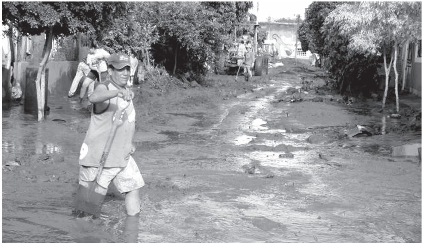
"Lodo a las rodillas afuera y dentro de las casas en la colonia Guadalupe".

Fue en la colonia Guadalupe donde una víctima de la inundación narró: "A