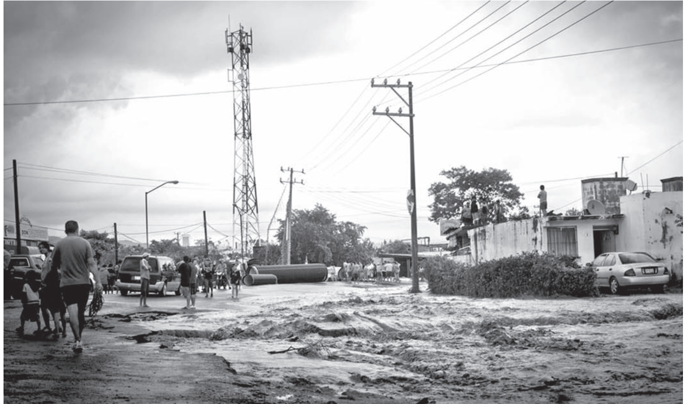
Cientos de personas no tomaron en cuenta a Jova, hasta que llegó.

Decenas de maestros de primarias federales tuvieron conflictos con los Inspectores de sus zonas escolares costeras. Con el aviso de la llegada de Jova y la inasistencia de los alumnos optaron por ir a sus casas en Autlán.