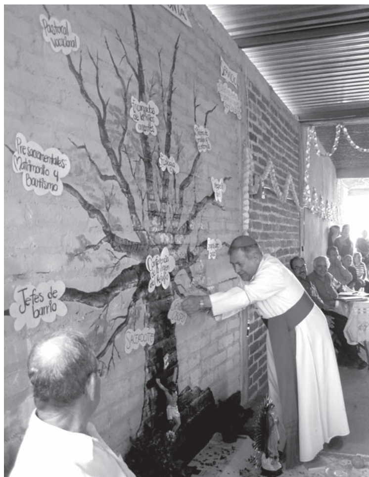
El señor obispo reubicando el árbol de los servicios pastorales del centro tres.

Las Visitas Pastorales continúan. Don Rafael ha terminado de visitar todas las parroquias de la Sexta Vicaría. Ahora, en próximas fechas, se dispone a recorrer las parroquias de la Tercera Vicaría a partir del mes de noviembre. Esperamos que su presencia impulse la misión evangelizadora en todos los barrios y ranchos de las comunidades parroquiales. ●