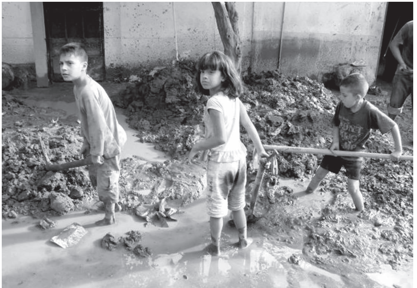
"Niños quitando el lodo de su casa. Colonia Guadalupe Autlán".

Sólo algunas familias tomaron previsiones. Otros se fueron a dormir el martes 11 de octubre arrullados por la lluvia cuando despertaron, tenían un huracán encima.