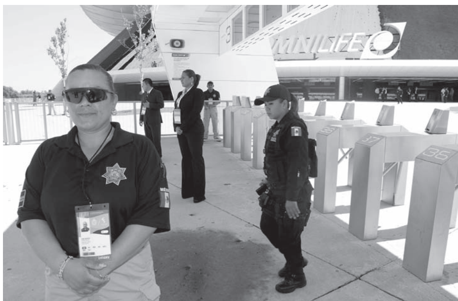
Una de tantas muestras de la militarización que se vivió en los Juegos Panamericanos.

Las y los demás habitantes tendremos ganancias tangenciales y secundarias; es decir, sufriremos los efectos y disfrutaremos muy poco de los beneficios. Finalmente la fiesta es sólo de algunos pocos. ●