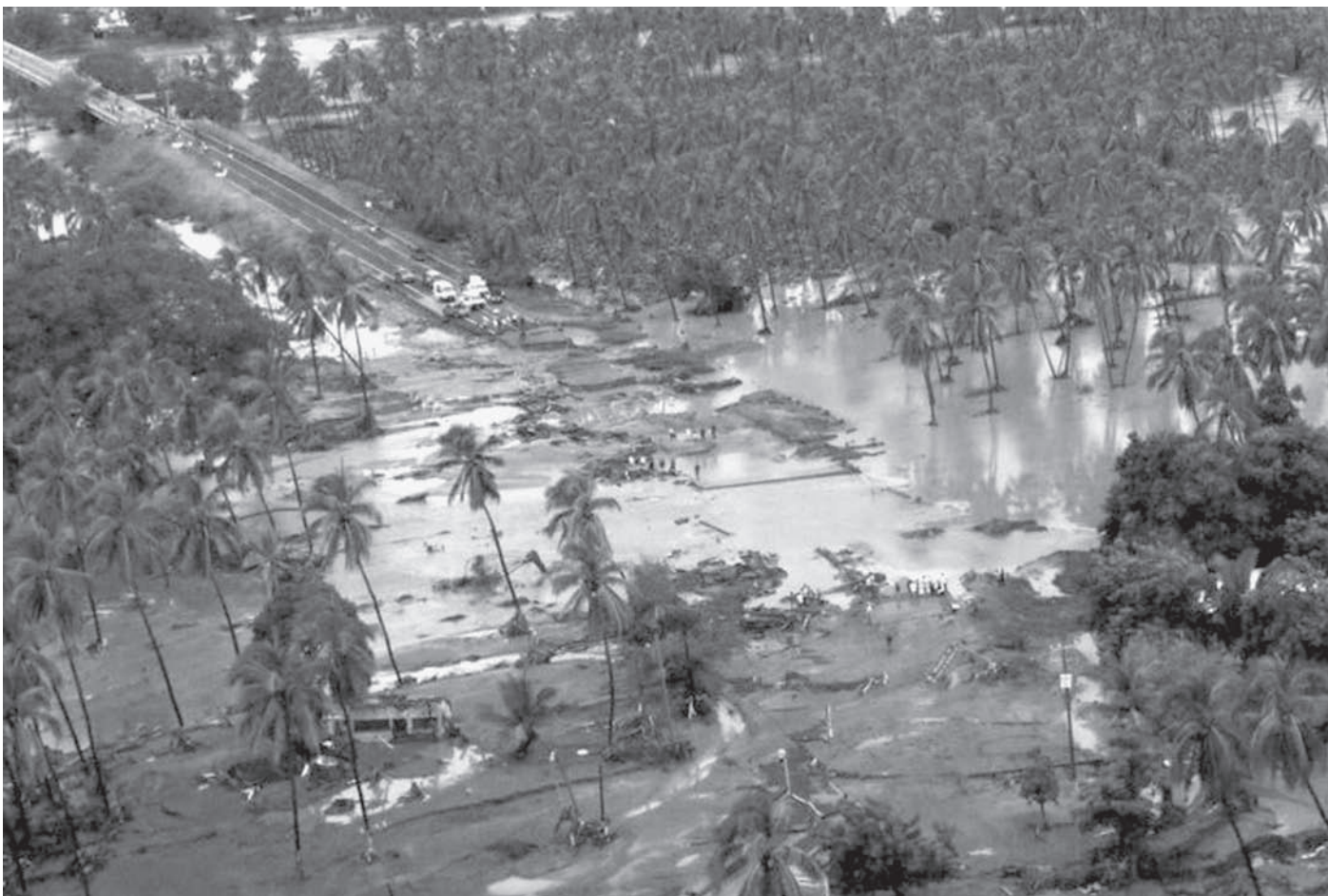
"Caminos destruidos el pretexto para la especulación de productos básicos"

Las personas comenzaron a salir de su casa la mañana del jueves. Observaron cómo el cauce de los arroyos y las calles trajeron lodo y basura y dañaron construcciones, vehículos y sobre todo, mataron a once personas. Sin embargo los gritos de auxilio más fuertes, llegaron de los municipios costeros.