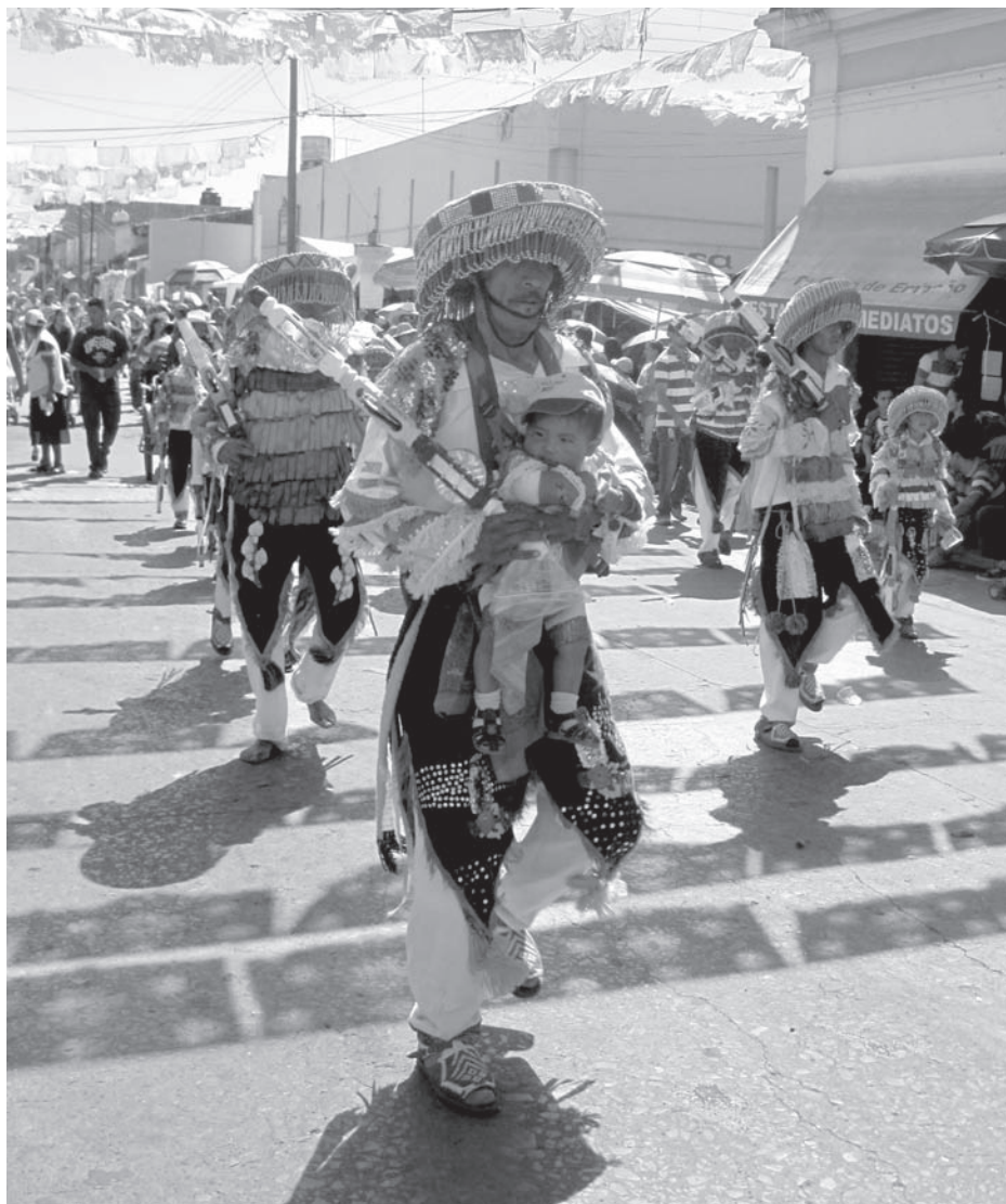
La fe se expresa en múltiples devociones y manifestaciones. Para los sonajeros, "Danzar" es una manera de orar.