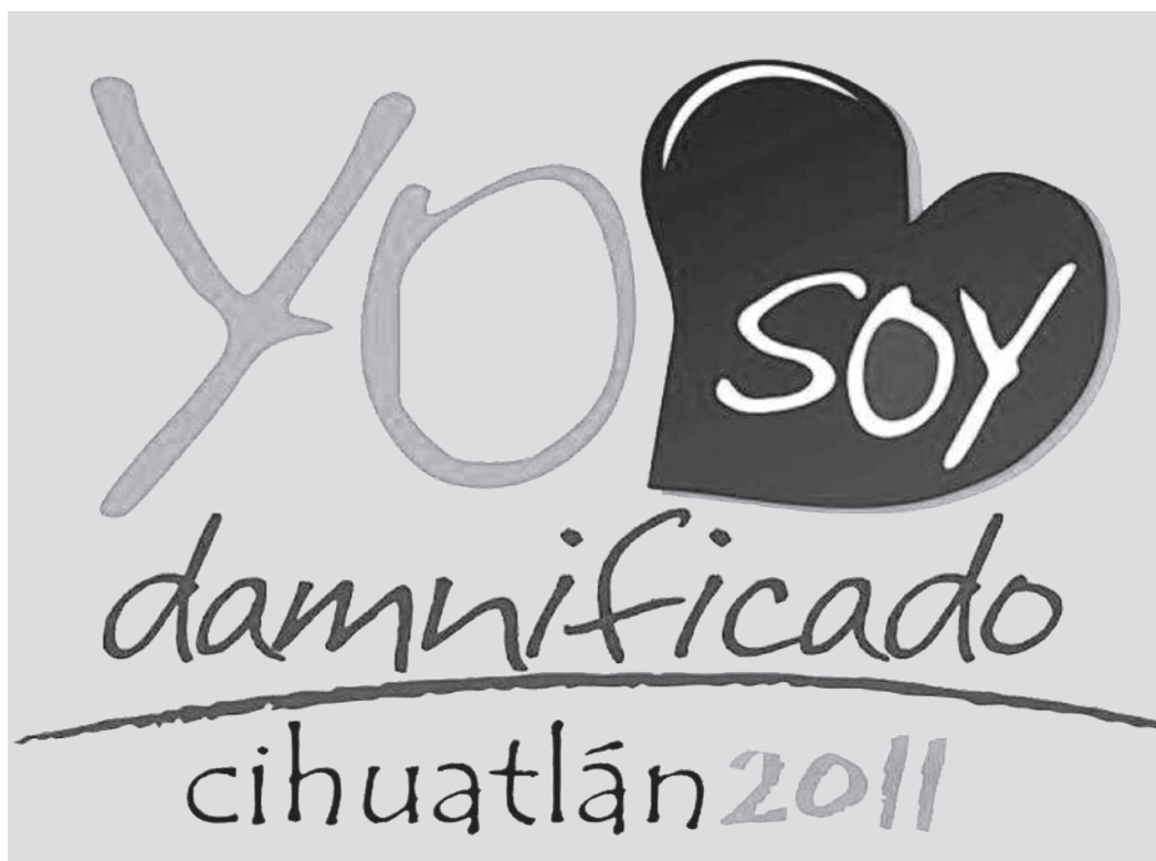
“Protesta en redes sociales por el desinterés del Gobierno del Estado”.

A lo largo del temporal, los distintos Gobiernos Municipales de la región Costa Sur declararon que estaban preparados para cualquier contingencia y que habían invertido recursos en limpieza de los arroyos. La basura en estas vías de agua, terminó por crear los daños más fuertes. Una vez pasada la emergencia los gobiernos municipales se vieron solos. El Gobierno del Estado estaba ocupado en la inauguración de los Juegos Panamericanos. Un día después del ciclón el Gobierno de Jalisco solicitó que a 13 municipios de la Costa Sur se les declarara zona de emergencia. Lo que abriría recursos sólo para apoyos en comida y enseres domésticos.