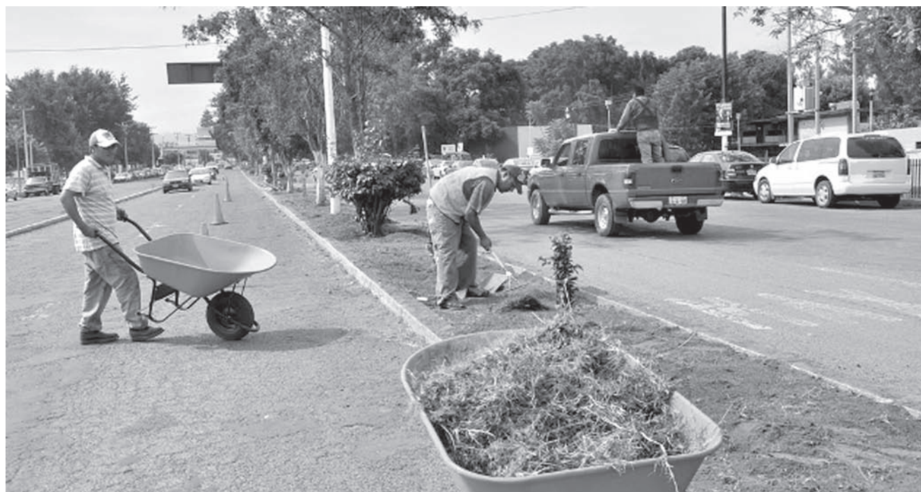
La construcción y remodelación de los espacios deportivos exigió la contratación de miles de trabajadores, que después de los Juegos, lo más probable es que engrosarán las listas de desempleados.

Sin embargo, vale la pena recuperar dos efectos políticos que tuvieron estos juegos en la escena política estatal. El primero fue la destitución de Alfonso Petersen Farah de la presidencia municipal de Guadalajara. El ahora Secretario de Salud y pre-candidato panista a la gubernatura, no terminó su periodo como alcalde de la capital de estado por su confrontación con Mario Vázquez Raña dueño de la Organización Deportiva Panamericana (ODEPA) y de los juegos panamericanos a propósito de la construcción de