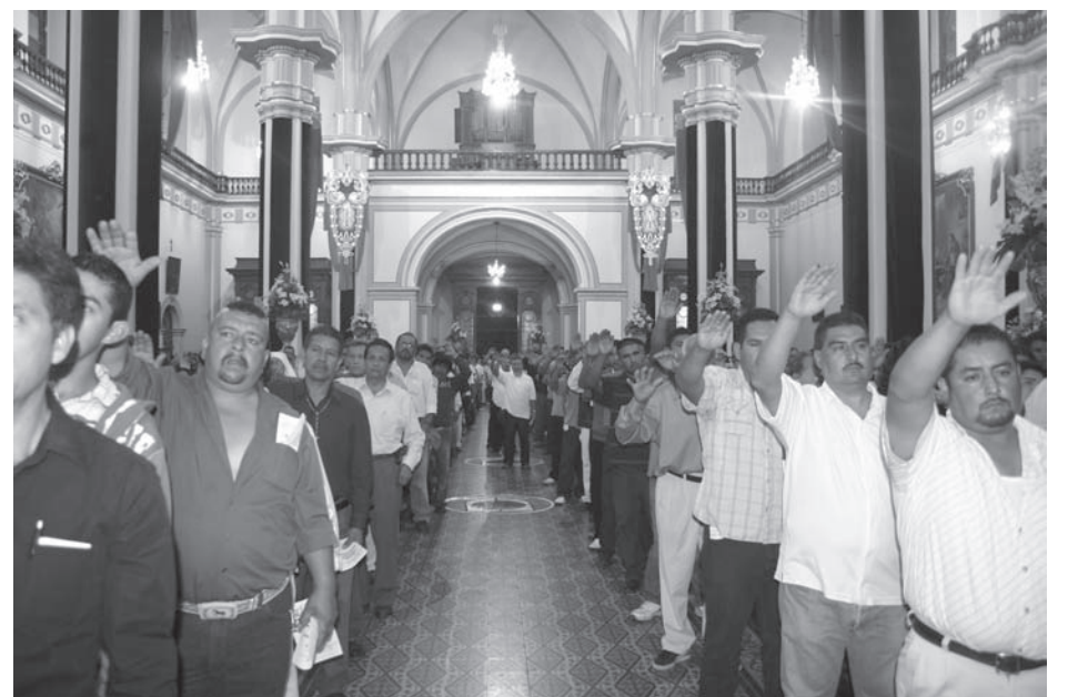
Grupo de Cargadores en la noche de la renovación del Juramento, el pasado 22 de octubre en Catedral.

La fiesta josefina en Zapotlán es tejida con el amor fiel y con el compromiso de un pueblo que expresa su fe en Dios y con cariño agradecido de un hijo con su padre Señor San José con quien establece una alianza con el firme propósito de cumplirlo, como bien lo expresa el P. Antonio Ochoa Mendoza: ¡Eres José, de Zapotlán dichoso. Gloria, consuelo, vida y esperanza: Patrono insigne, Padre cariñoso! ●