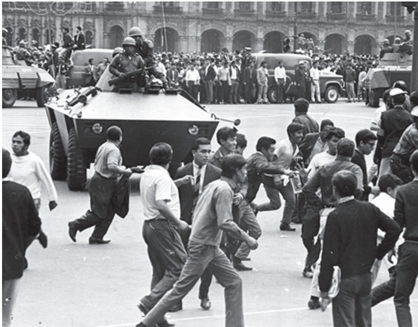
Represión militar de manifestación estudiantil.

El año 1968 es uno de los más dolorosos para la sociedad mexicana. El 2 de octubre de ese año, Tlatelolco se tiñó de rojo tras la manifestación estudiantil en la Plaza de las Tres Culturas. Al igual que en México, han sido muchos los movimientos estudiantiles que muestran las demandas de los jóvenes en distintos países del mundo, suponiendo la nula integración de sus expectativas en el desarrollo nacional a lo largo del tiempo.