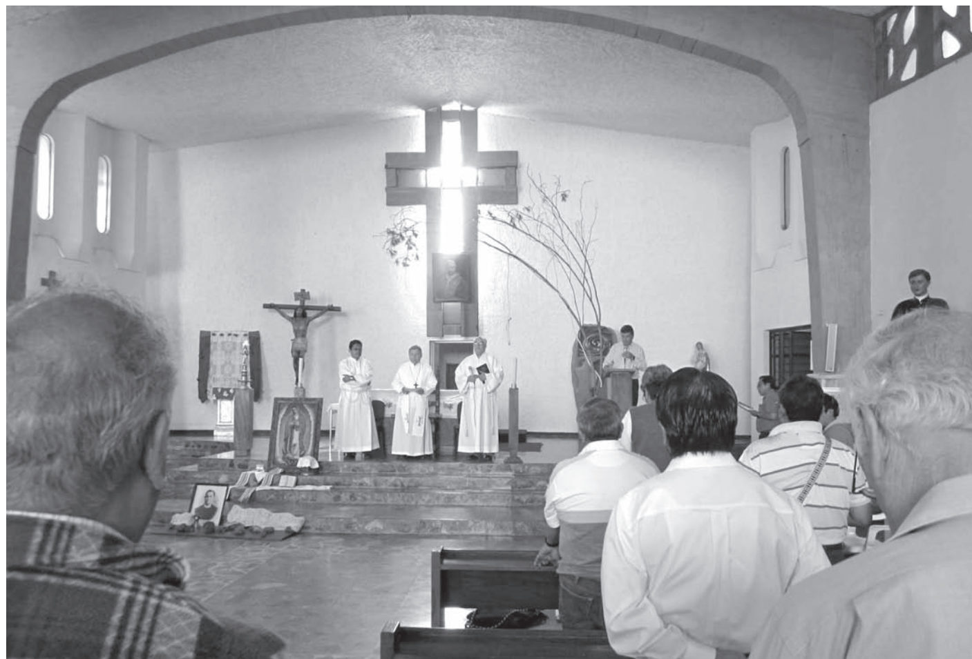
Los sacerdotes en el momento de oración, en la capilla Pío X del Seminario Mayor.