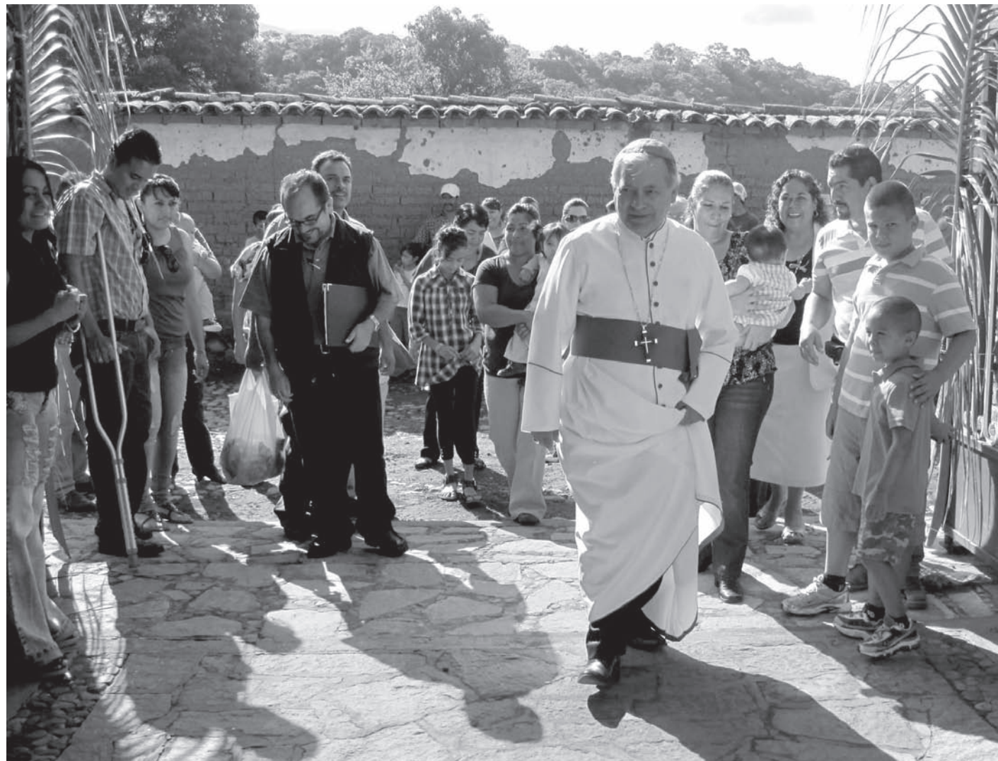
Llegada del Señor Obispo al centro dos de la parroquia de Jiquilpan.