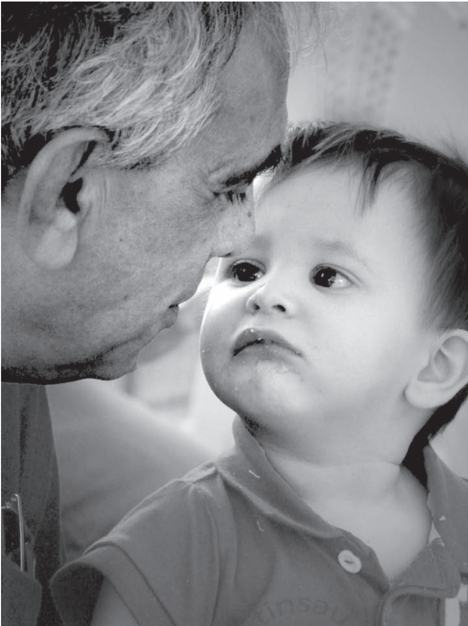
El nieto contempla el amor de su abuelo

“La vida se comprende mirando hacia atrás, pero sólo puede ser vivida mirando hacia adelante. No dejes que la tristeza del pasado y el miedo del futuro estropeen la alegría del presente”