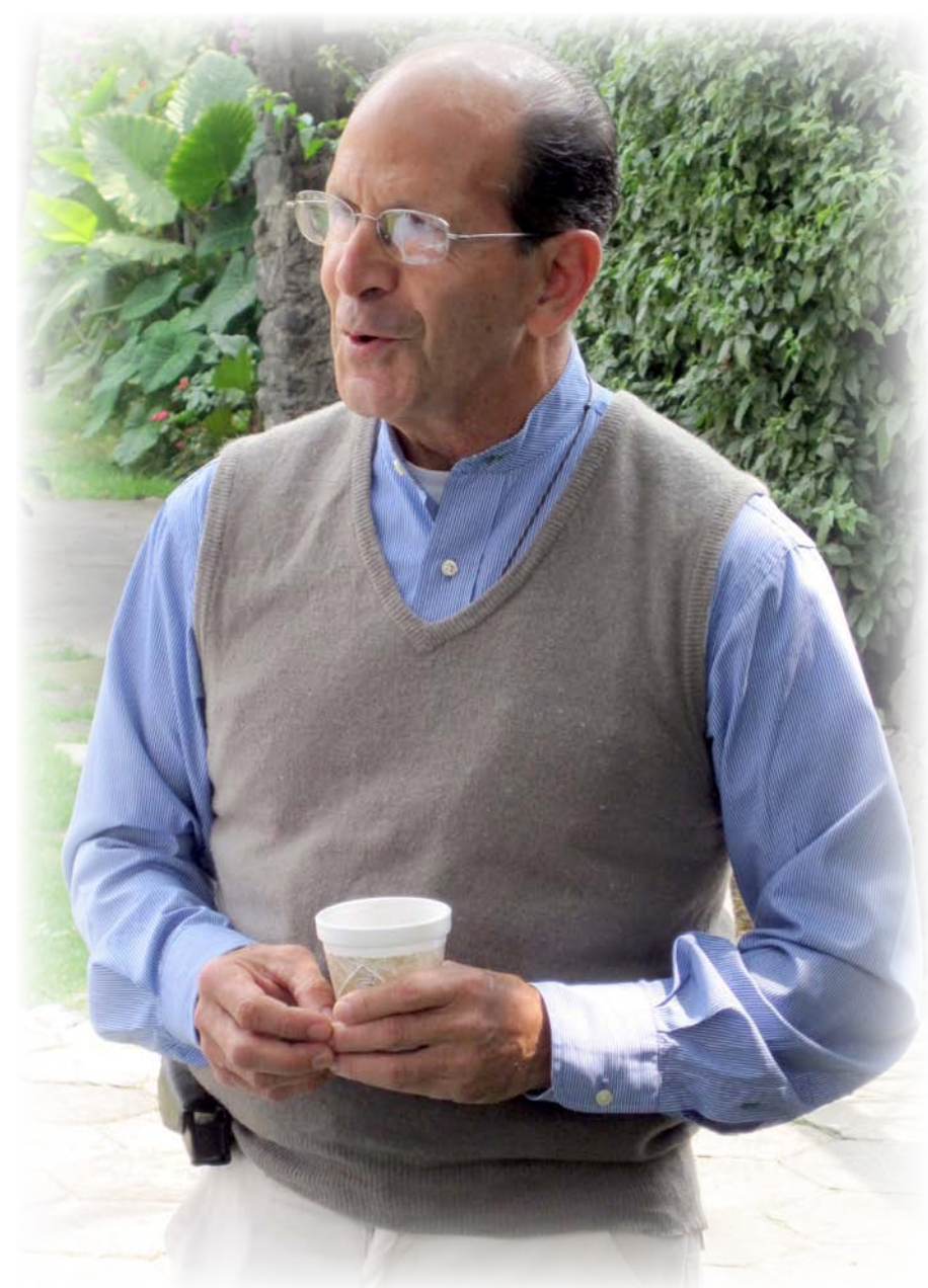
El Padre Alejandro Solalinde.

Un ejemplo de las intimidaciones que sufre el P. Solalinde ocurrió el 24 de junio de 2008, cuando un grupo de 50 residentes de Ixtepec, encabezados por el alcalde y 14 policías municipales, irrumpieron en su albergue. Amenazaron con prender fuego a él y al albergue si no se cerraba en un plazo de 48 horas. “Fue un momento difícil, pero a la vez muy alentador. Caí en la cuenta de que yo soy migrante, que mi misión es ser instrumento de Dios con el compromiso de seguir caminando en la ruta de Cristo, con la esperanza de que estos hermanos cumplan con su anhelo de buscar un espacio donde hacer una vida diferente y un trato humano, como sujetos, no como objetos desechables. Aunque son