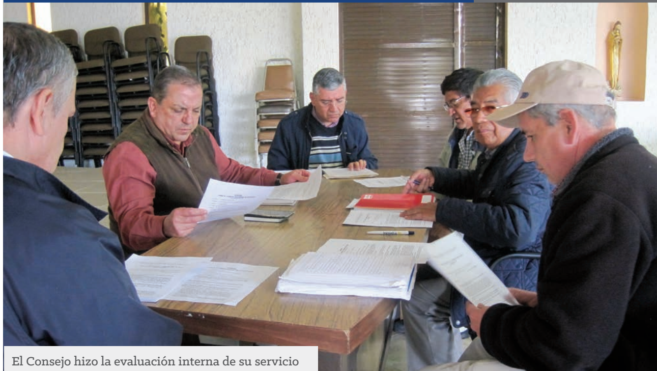
El Consejo hizo la evaluación interna de su servicio

EL CONSEJO DIOCESANO DE PASTORAL TERMINA SU PERIODO 2015-2018