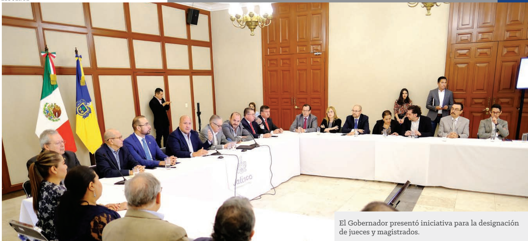
El Gobernador presentó iniciativa para la designación de jueces y magistrados.