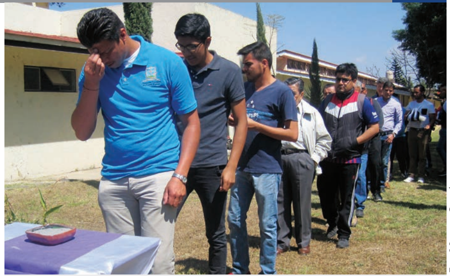
El discípulo misionero debe estar en permanente conversión