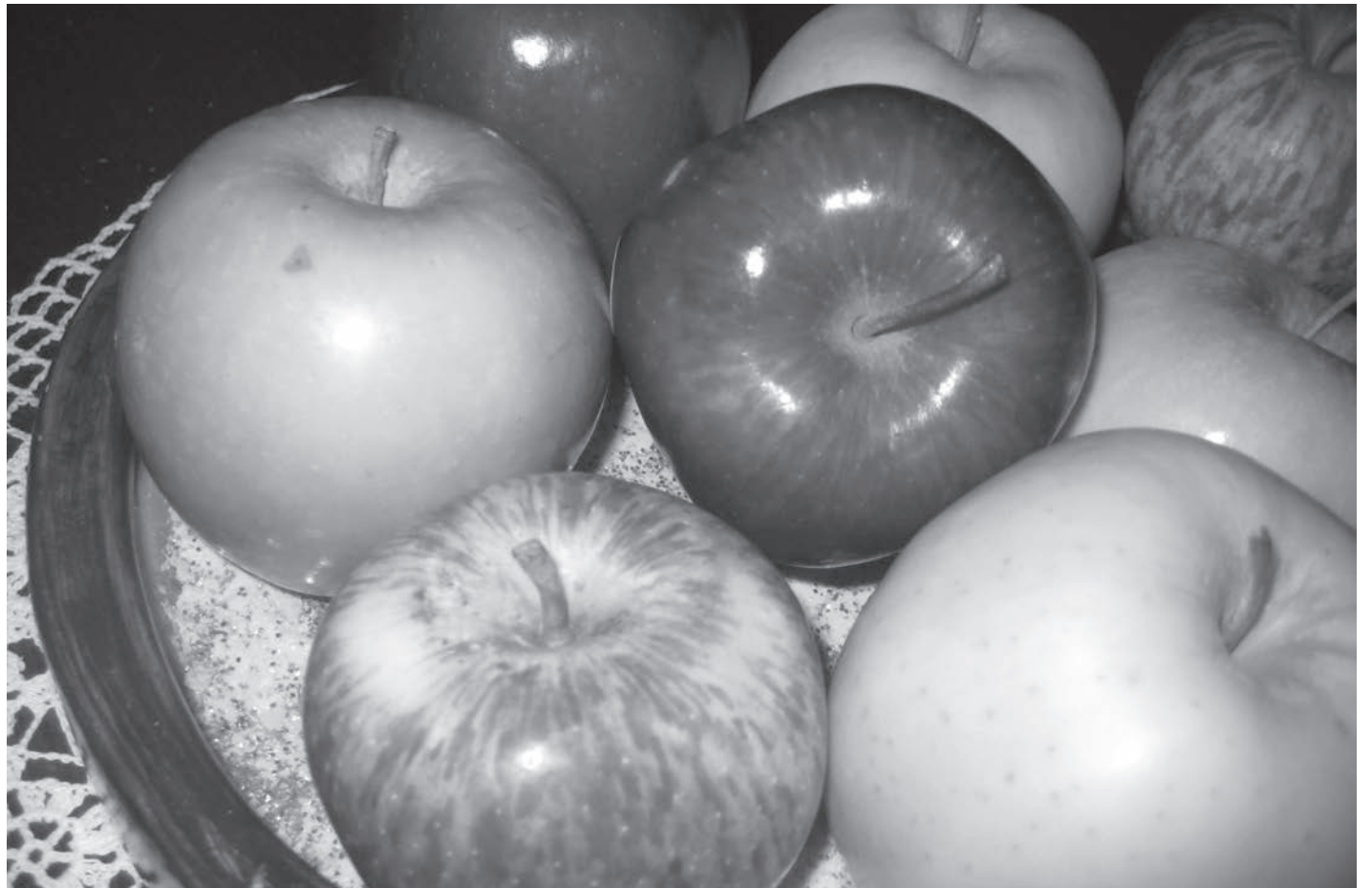
Las manzanas ayudan a combatir el Alzheimer, la diabetes, el cáncer de pulmón y el asma.

Dentro de sus propiedades nutricionales se encuentra que cada manzana de aproximadamente 100 gramos aporta: 85 gramos de agua, 0.4 gramos de grasa (libre de colesterol), 14 gramos de azúcares (fructosa y pectinas fundamentalmente) 0.3 gramos de proteínas. En cuanto a minerales podemos encontrar: 144 miligramos de Potasio, 10 miligramos de Fósforo, 7 miligramos de Calcio, 1 miligramo de sodio, 0.3 miligramos de Hierro. De vitaminas podemos encontrar Vitamina A, Vitamina B1, Vitamina B2,