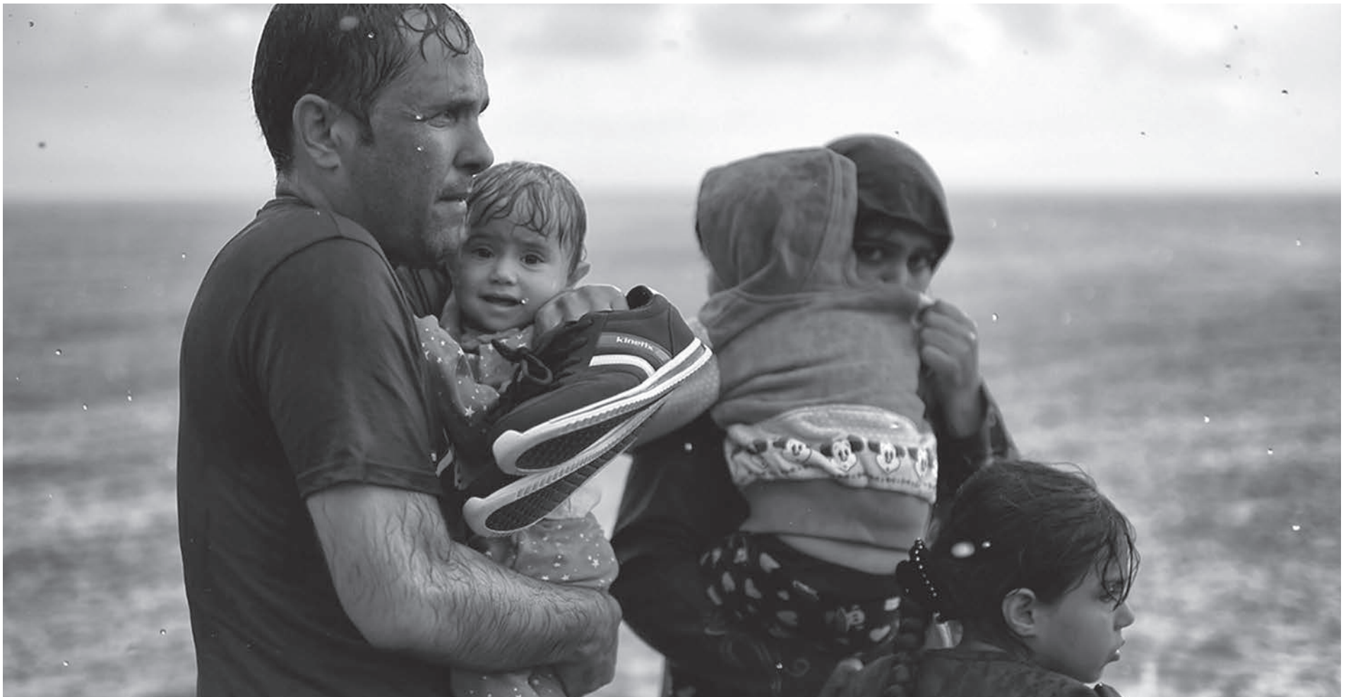
En éxodo de los refugiados y los migrantes, además de enfrentar las barreras humanas y políticas, deben enfrentar las inclemencias del clima.