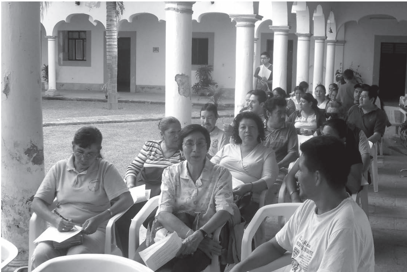
Laicos en una Asamblea de la Zona San Gabriel, de la sexta vicaría.