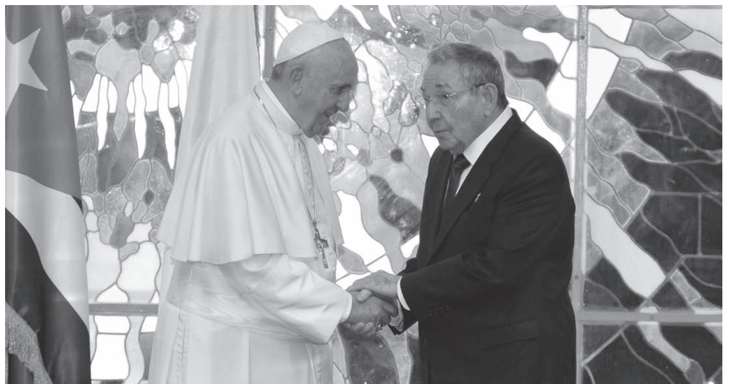
El Papa Francisco y el mandatario cubano Raúl Castro.

Y como conclusión, el Papa deseó que el Espíritu Santo, con la intercesión de María Santísima, haga crecer las semillas del Evangelio que se han esparcido. ●