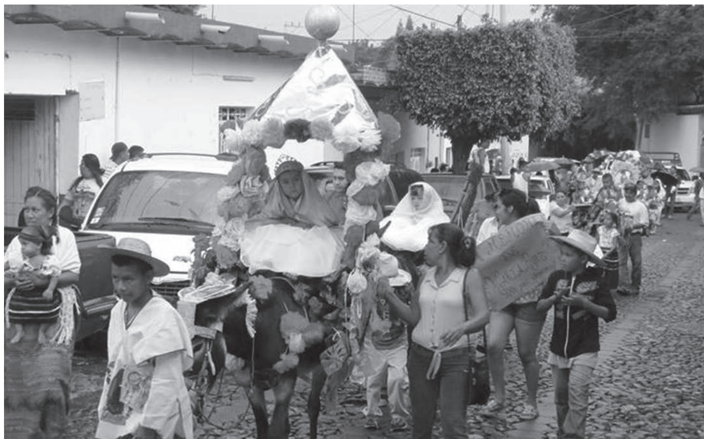
Entrada de burros.

Ahí acordaron que unos llevarían leña de mezquite y otros leña de órgano pitayero. La leña de mezquite iban a utilizarla para la preparación de alimentos y bebidas calientes y la leña de órgano pitayero para iluminar el lugar. La razón de utilizar leñas diferentes es que la leña de mezquite produce buena brasa y dura mucho. La leña de órgano pitayero no produce mucho humo y su luz es muy intensa. Además de las fogatas se construían ramadas de madera y palapa para resguardarse del frío o de la lluvia. Debajo de las ramadas, también hacían nixtencos y pretiles para cocinar. Fue así como cada año, el día 14 de agosto muchas personas voluntarias llevaban por