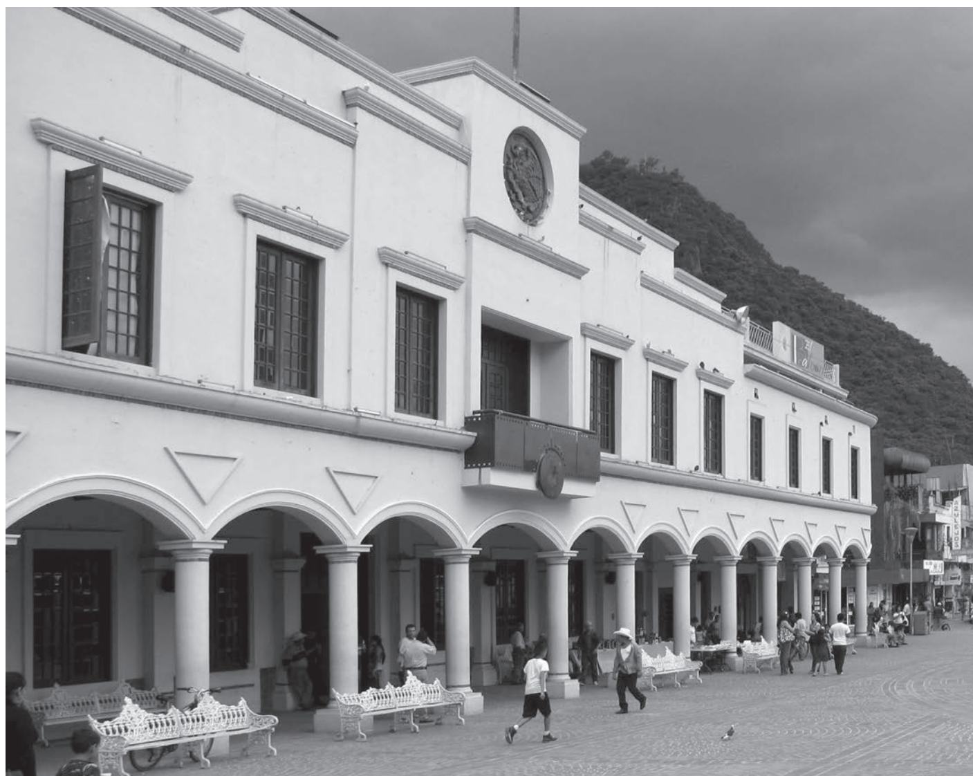
Palacio municipal de Tamazula de Gordiano.

Entiendo que mis propuestas implican mucho trabajo y transformaciones radicales, pero me queda claro que si queremos resolver los problemas de esta región, no podemos pensar de otra manera, es decir, a problemas profundos, soluciones de raíz. ●