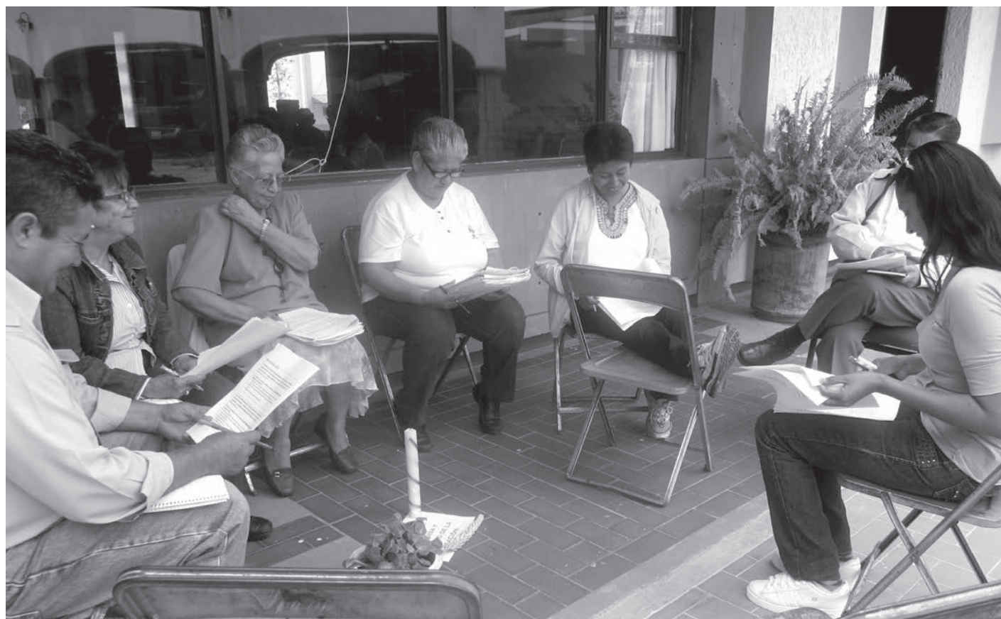
Grupo de trabajo del Consejo Diocesano de Pastoral.

Animados por todo lo anterior, quedó claro que lo central del Año Jubilar es fortalecer como DCG la misión hacia los alejados. ●