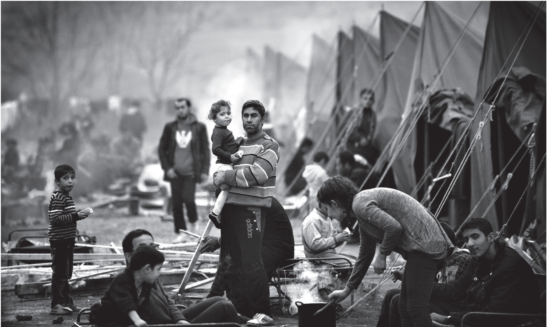
El trato que se le da a los refugiados en algunos países es de exclusión, segregándolos en campos de refugiados, que en ocasiones presentan situaciones de hacinamiento.