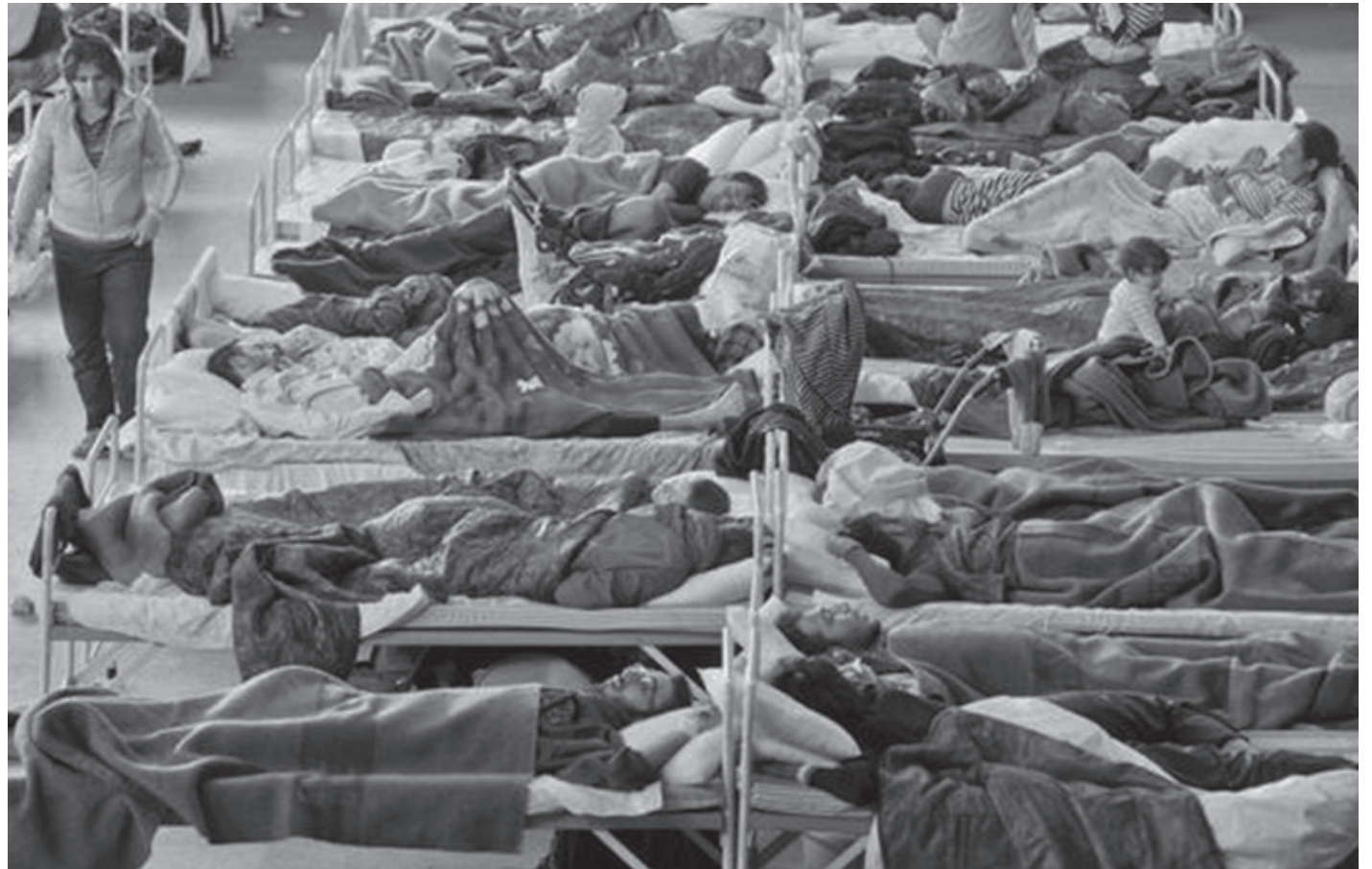
En México, los migrantes centroamericanos también son refugiados que huyen de la inestabilidad política de sus países.

Tal es el caso de Texas, en donde se ha negado la ciudadanía a hijos de migrantes mexicanos nacidos en ese estado, un serio problema para los