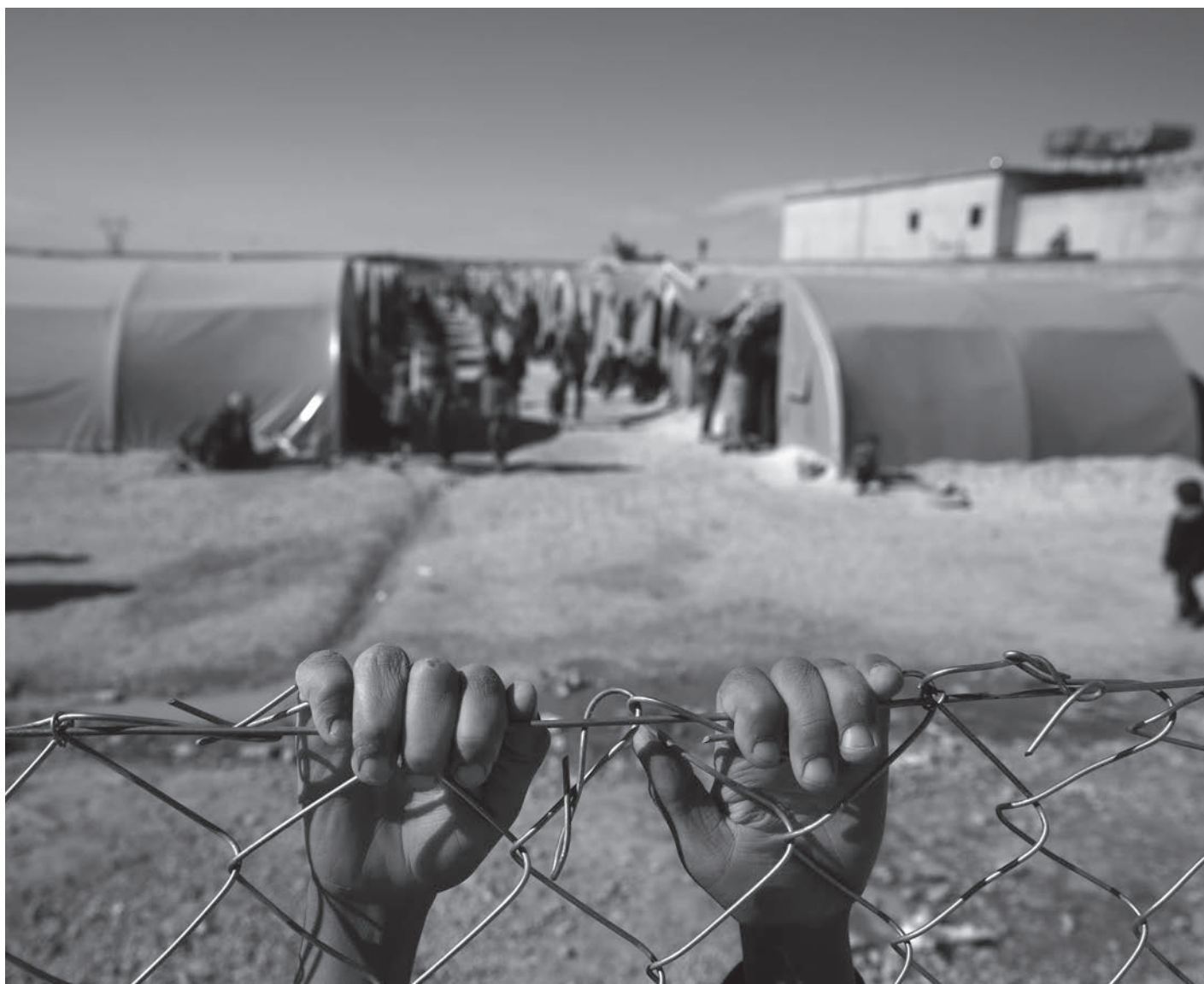
El Papa Francisco nos invita a ser solidarios con aquellos que sufren, sin importar sus teologías.