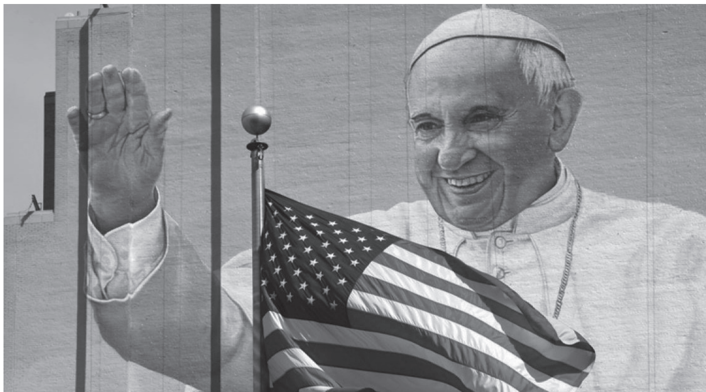
Francisco es el primer Papa en la historia en hablar ante el senado de Estados Unidos

Varias de las reuniones que tuvo el Papa Francisco como autoridades cubanas y