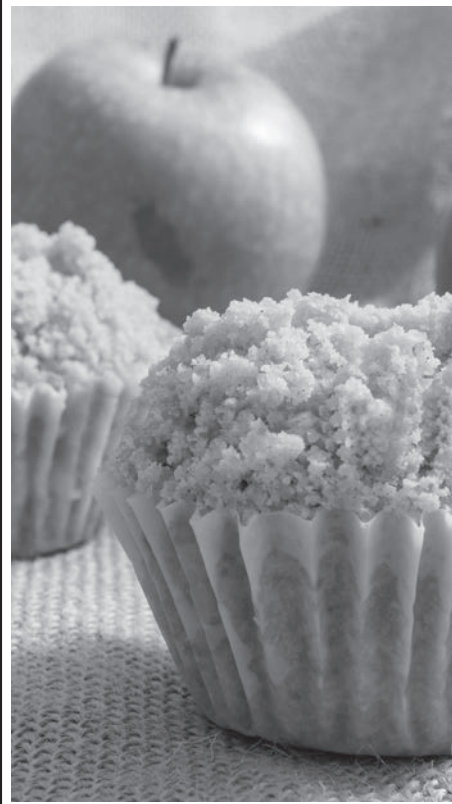
Muffin de manzana.