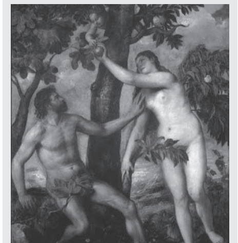
Pintura "Tentación de Adán y Eva" de Tiziano.

Cuenta la historia que después de ser encarcelado por no haber hecho reverencia a una estatua que representaba la casa de Austria, Sir Guillermo Tell fue obligado a disparar con una ballesta a una manzana que colocaron sobre la cabeza de su hijo menor. Desde entonces se volvió el "héroe" más popular de todo Suiza.