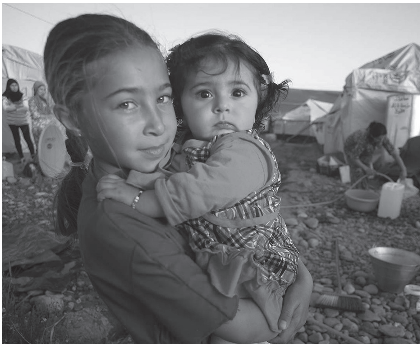
Dentro de los refugiados, los niños representan al grupo social más vulnerable.

Sin embargo, esta campaña no ha tenido el impacto mediático esperado, en buena medida porque la situación de violencia que vive el país hace de México un destino poco atractivo para asilarse, pero también porque la sociedad mexicana se enfrenta a problemas mayores como la crisis económica, la crisis política y la lucha contra el narcotráfico, que hacen pensar que el problema sirio no debe ser nuestra prioridad. En buena medi-