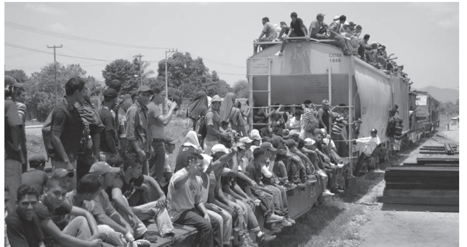
En México, los migrantes centroamericanos también son refugiados que huyen de la inestabilidad política de sus países.

En Guadalajara la xenofobia también fue experimentada por los migrantes centro y sudamericanos que viajan hacia Estados Unidos. Una de las lamentables consecuencias fue el cierre, el pasado julio, del Centro de Atención a Migrantes desde donde opera FM4 Paso Libre, una organización de la sociedad civil que se dedica a prestar ayuda a los viajeros. La decisión fue tomada a raíz de que los migrantes fueron atacados en dichas instalaciones por delincuentes que operaban en la