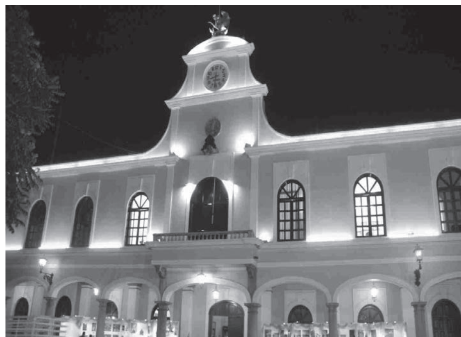
Palacio Municipal de Ciudad Guzmán.

Es cierto que dentro de las responsabilidades municipales no está la creación de empleos ni dictar políticas al respecto, sin embargo, por el tipo de características que tienen los municipios del Sur de Jalisco es necesario que estos gobiernos locales asuman un rol protagónico como gestores del desarrollo económico, es decir, que promuevan la actividad económica e incrementen el número y la calidad de los empleos en sus demarcaciones. Junto con lo anterior, es necesaria la creación de programas sociales que de forma creativa y no asistencial abatan la pobreza en la región.