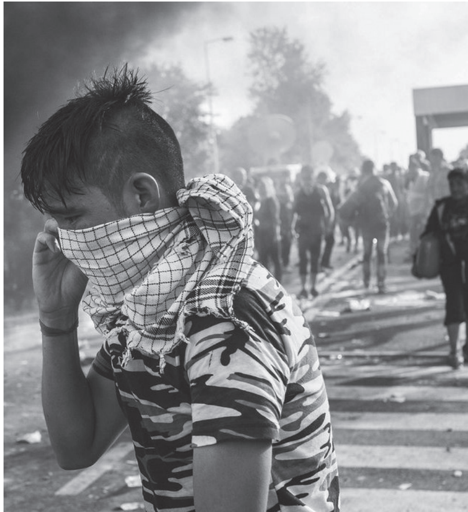
Un refugiado tapa su rostro para no respirar los gases lanzados por la policía húngara en la frontera con Serbia.

Sin embargo, otros replican que los inmigrantes en Estados Unidos, ya sean latinos, indios, franceses o de cualquier nacionalidad, todos, han contribuido